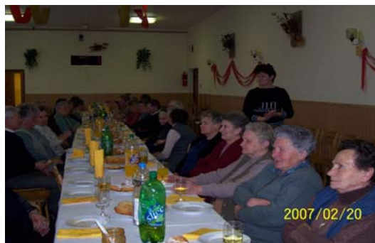
A vendégeket terített asztal várta a Művelődési Házban