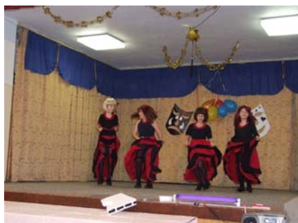
Kánkános lányok (4. osztályos fiúk)