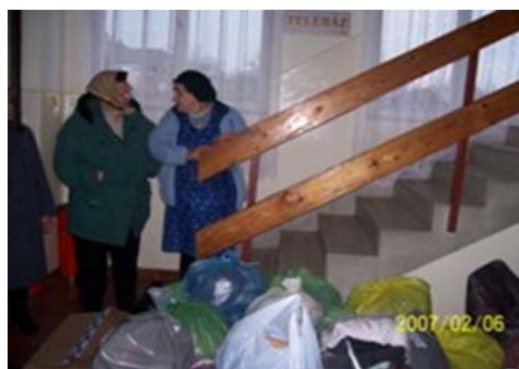
Ruhagyűjtési akció a Művelődési Házban