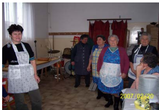
A klub dolgozói és a klubtagok készítették el a farsangi fánkot a mulatságra

Este 6 körül ért véget a mulatozás; jó kedvvel, derűsen váltunk el, annak tudatában, hogy ismét egy kellemes délutánt töltöttünk el együtt.