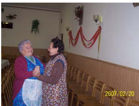
Kézimunka-kiállítás és télbúcsúztató farsangi multság