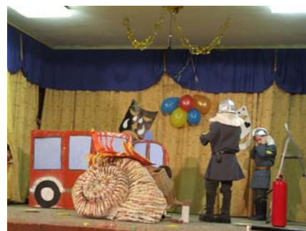
Ifjúsági Tűzoltó Egyesület (2.osztály)